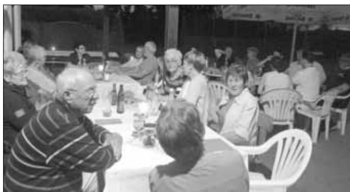
Das TC-Sommerfest dauerte bis lange in die Sommernacht