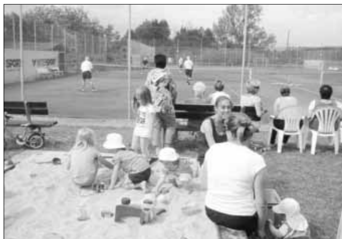
Das Ortsvereinsturnier wird wieder zum Familientreffen zahlreicher Villmarer Vereine