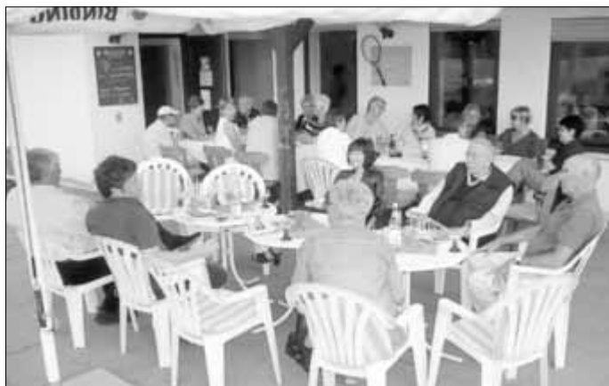
Die TC-Clubhausterrasse ist ein beliebter Ort des Feierns