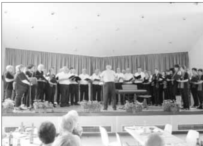
MGV Aumenau Teutonia Villmar