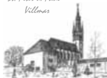
St. Peter u. Paul Villmar